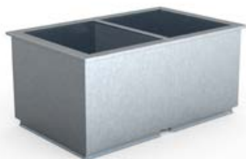
Takgenomföring för Hagabs kombihuvar.