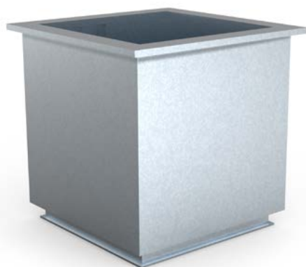
Takgenomföring för Hagabs takhuvar.