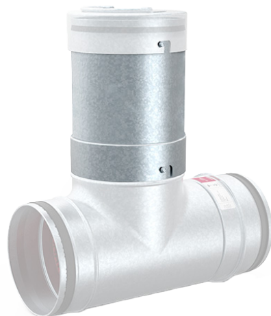
Basic 4 med förlängt inspektionsrör

Förlängt inspektionsrör används då man vill överisolera BASIC och kanalerna, eller vid lösulls-isolering.